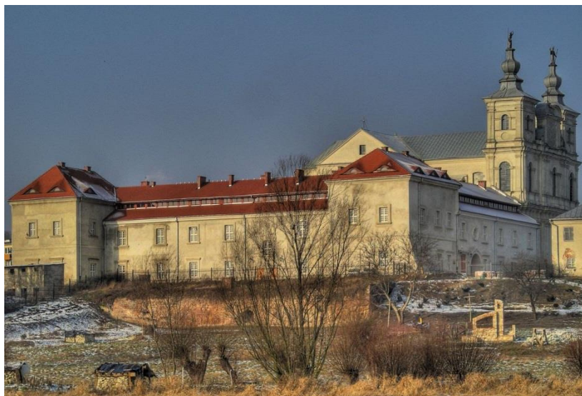
Dawne kolegium i kościół św. Franciszka