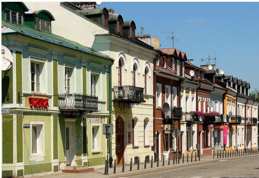
Kamienice na rynku