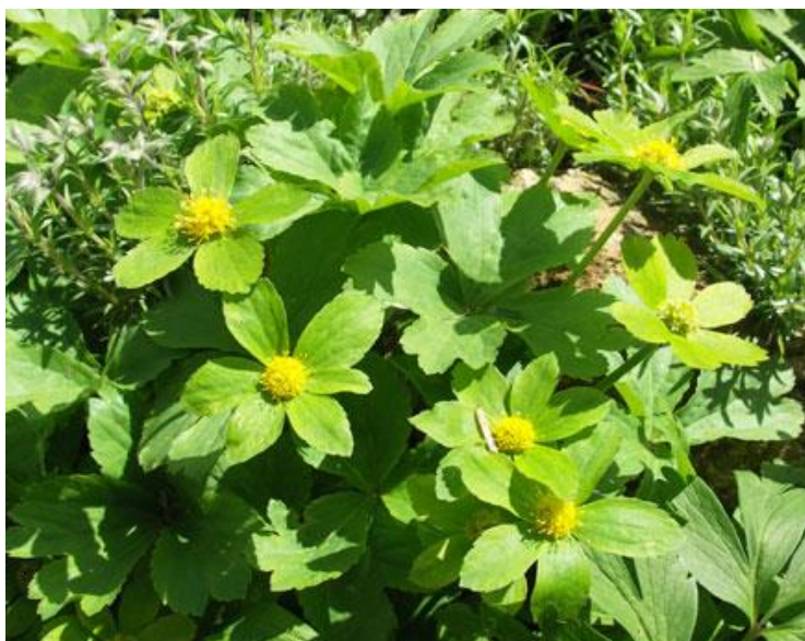
Cieszynianka wiosenna ( Hacquetia epipactis ) w Cieszynie